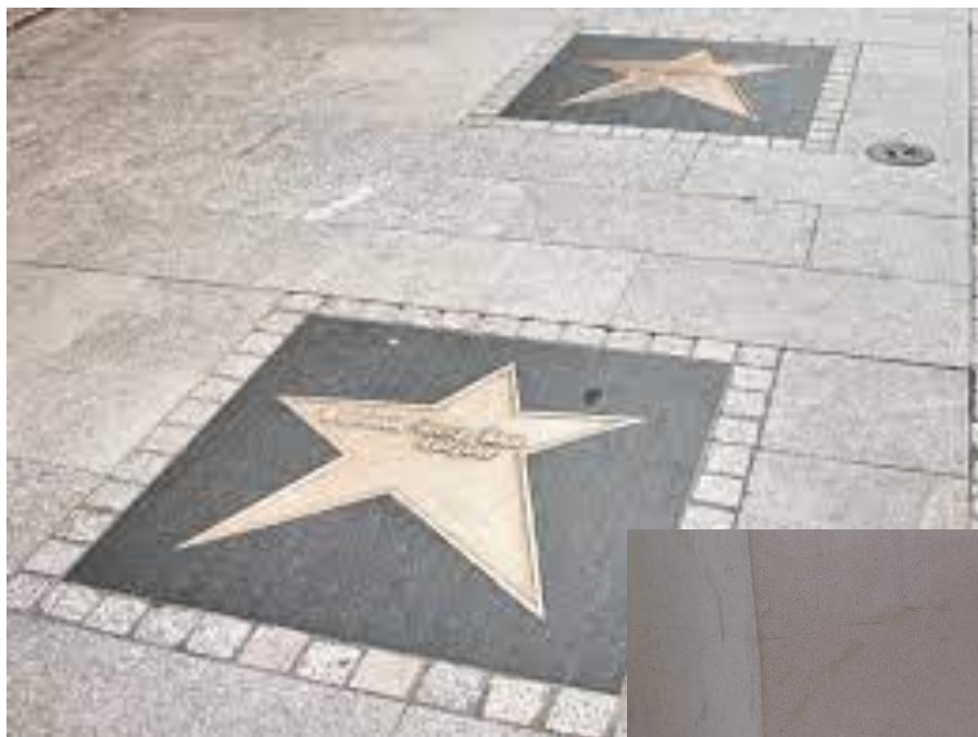
Aleja Gwiazd przy ul. Piotrkowskiej