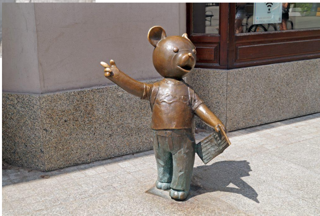
Figurka Misia Uszatka przy ul. Piotrkowskiej